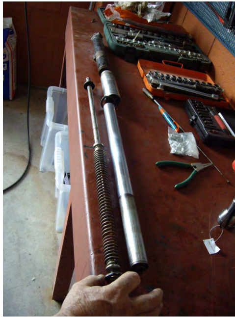
Detall de la suspensió original desmuntada

El manillar es cromatja i la resta de peces es pinten o poleixen podent ser aprofitades.