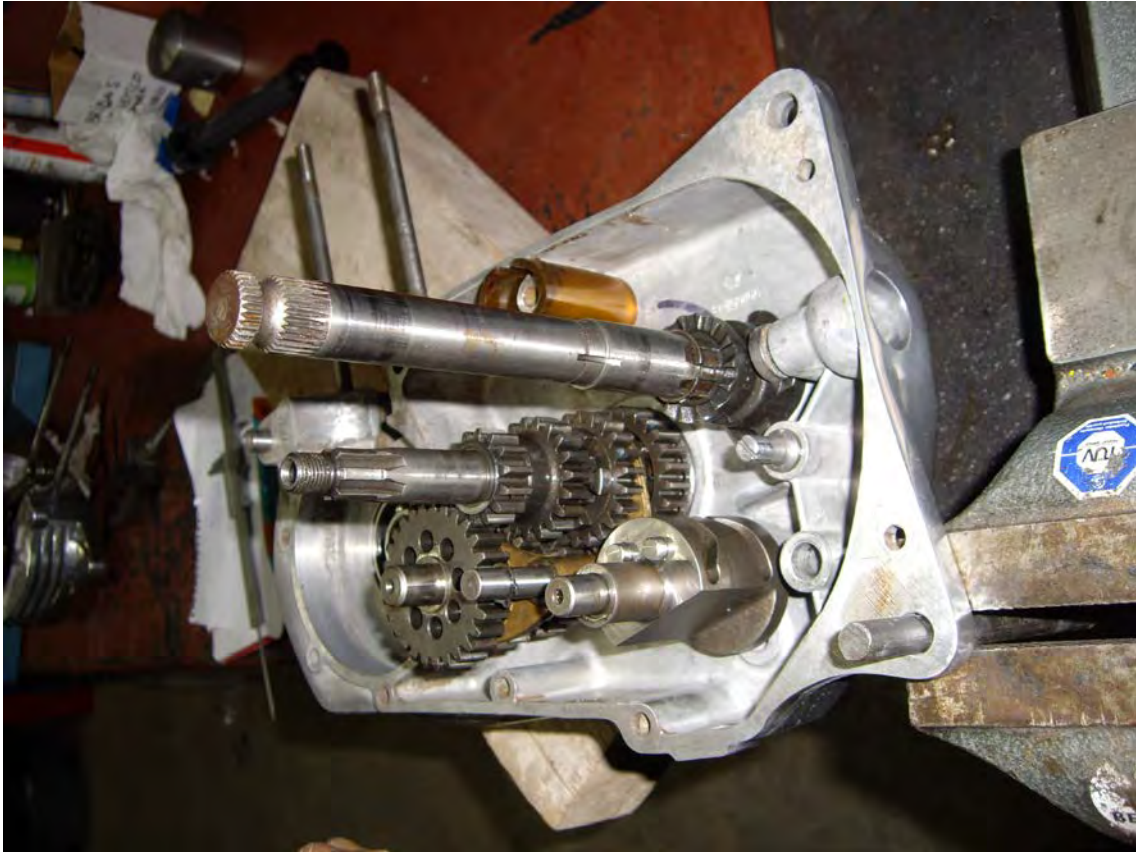
Inserció del canvi als cartes polits