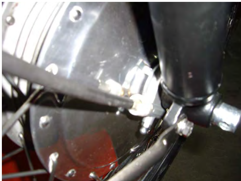
Destall del nou reenviament.

El reenviament de comptakilòmetres es canvia per un de nou ja que l'original és irreparable.