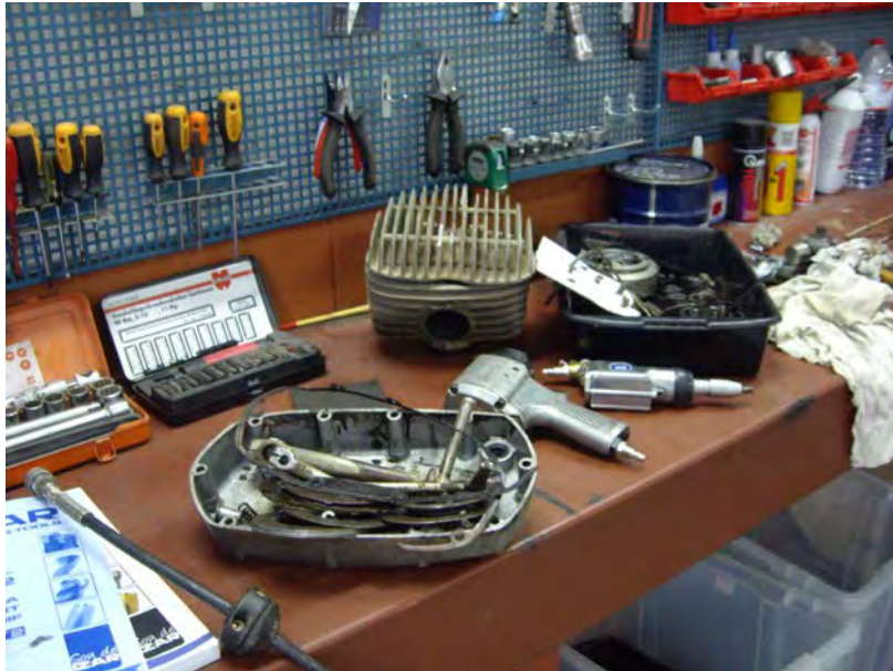
Desmuntatge del motor

El carburador es neteja amb ultrasons i es munta.