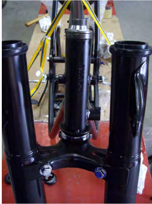
Protectors de la forquilla arreglats i pintats

Pel que fa als parafrangs s'ha procedit a massillar-los i repintar-los.