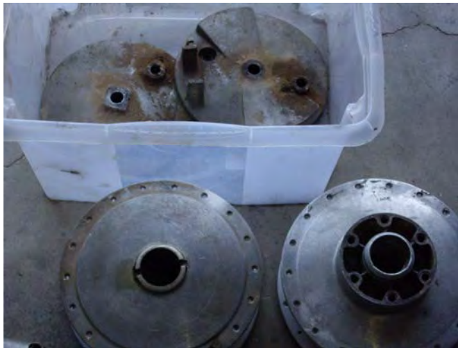
Llandes i cubs abans de polir.