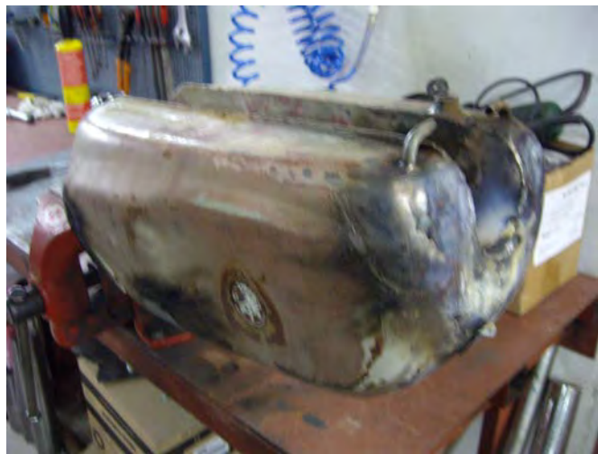
Dipòsit en l'estat que va venir amb les fugues arreglades.

Es procedeix al sorrejat, se li solda la fuga i se li realitza un tractament químic intern per evitar futures fugues i realitzar-li una neteja. Posteriorment es procedeix a pintar-lo amb el color original i a col·locar-li uns anagrames nous, l'aixeta es canvia ja que l'original presenta fuites.