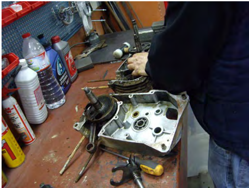
Desmuntatge dels carters