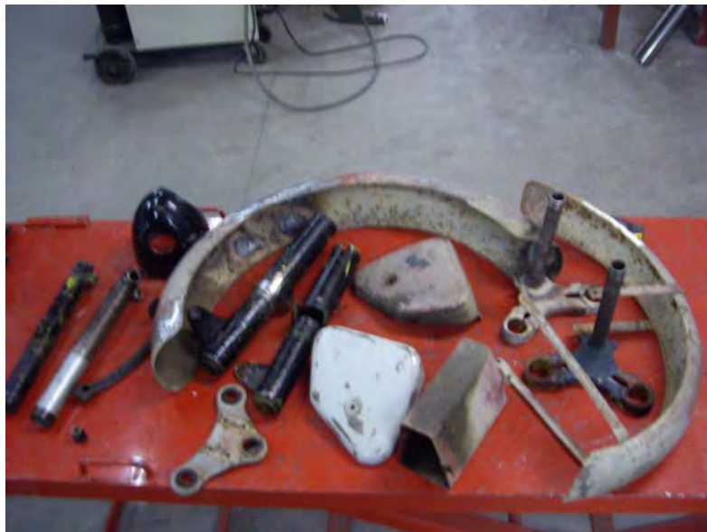
Peces de la correcceria abans de ser tractades.