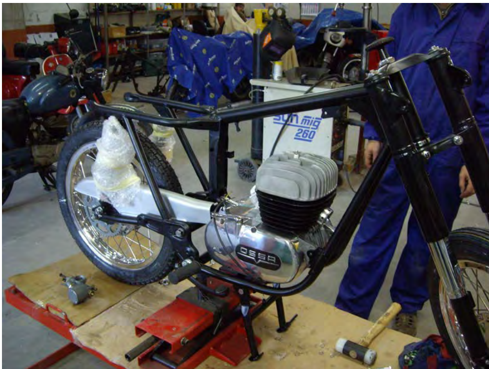
Motor tractat i instal·lat