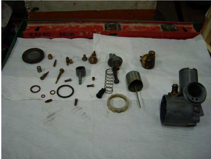
Peces del carburador tractades amb ultrasons abans de muntar