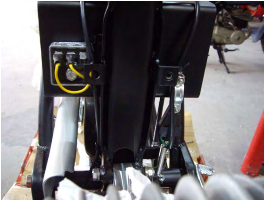
Instal·lació del regulador i llum de fre