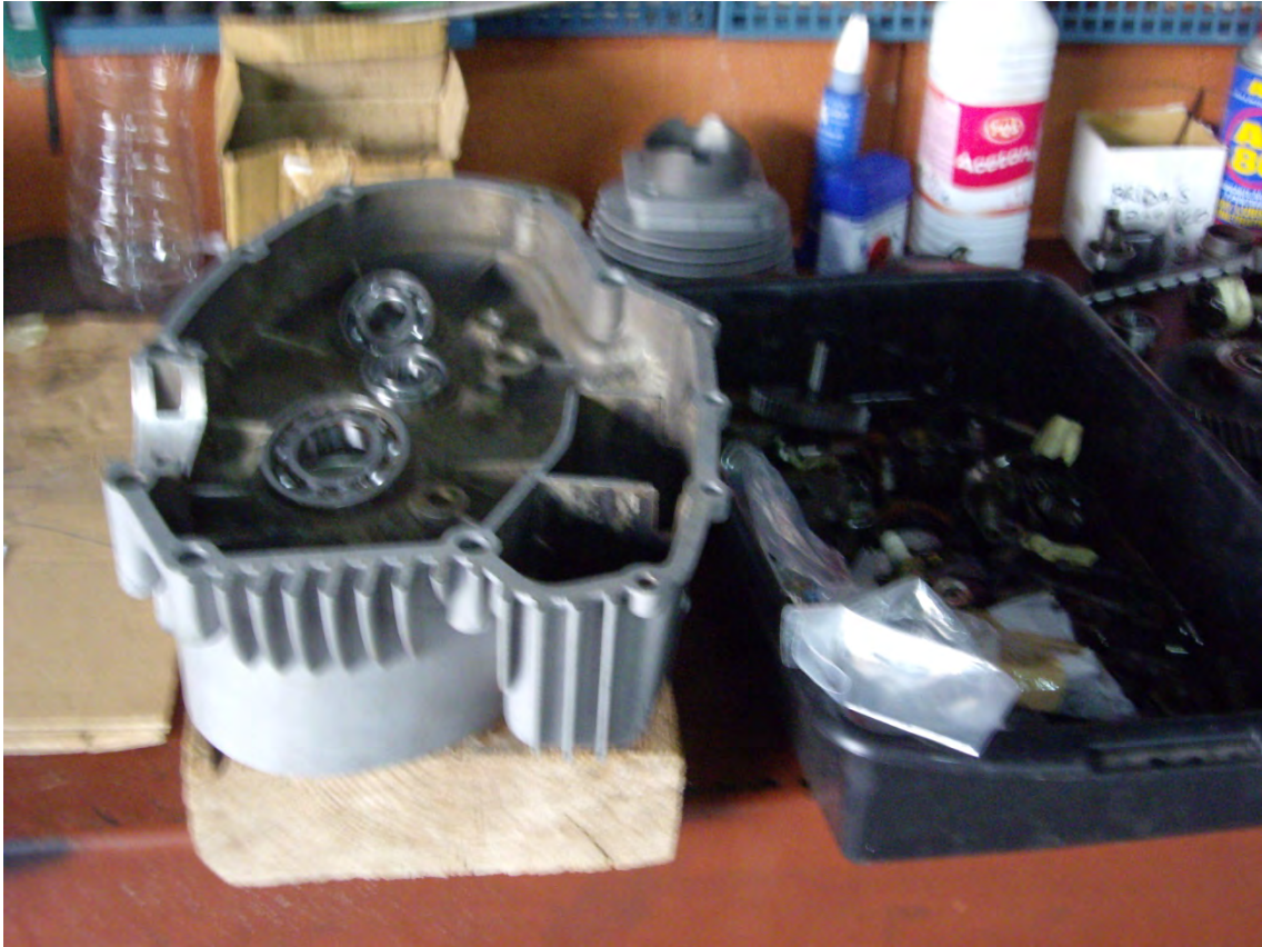
Bloc desmuntat amb els coixinets nous presentats