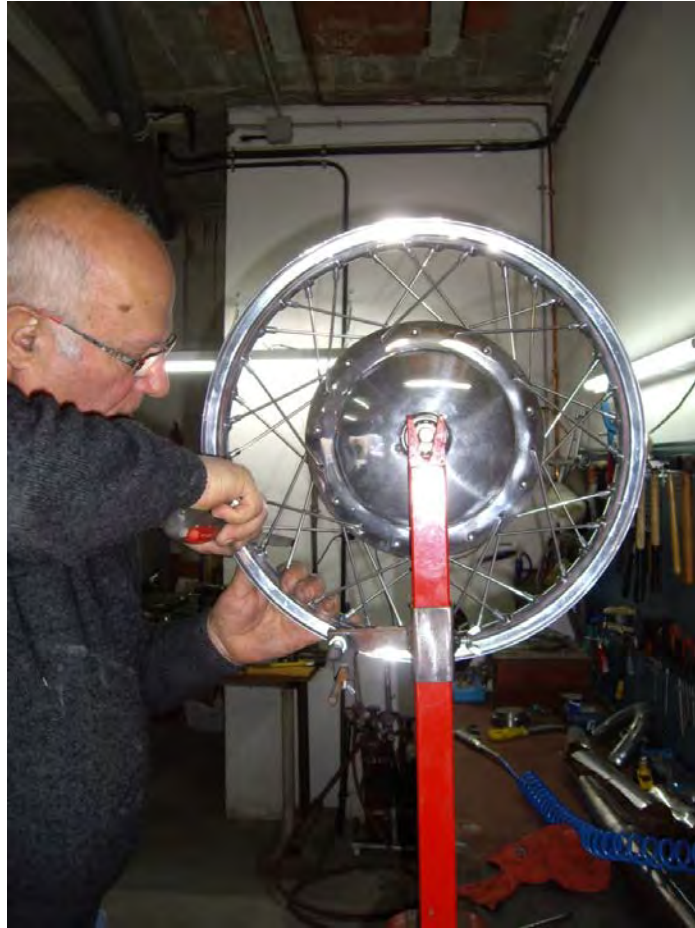
Radiat de les rodes.

En els frens es decideix recanviar-los de nou, i s'aprofita per canviar el material antic d'amiant per un de més modern i no tòxic.