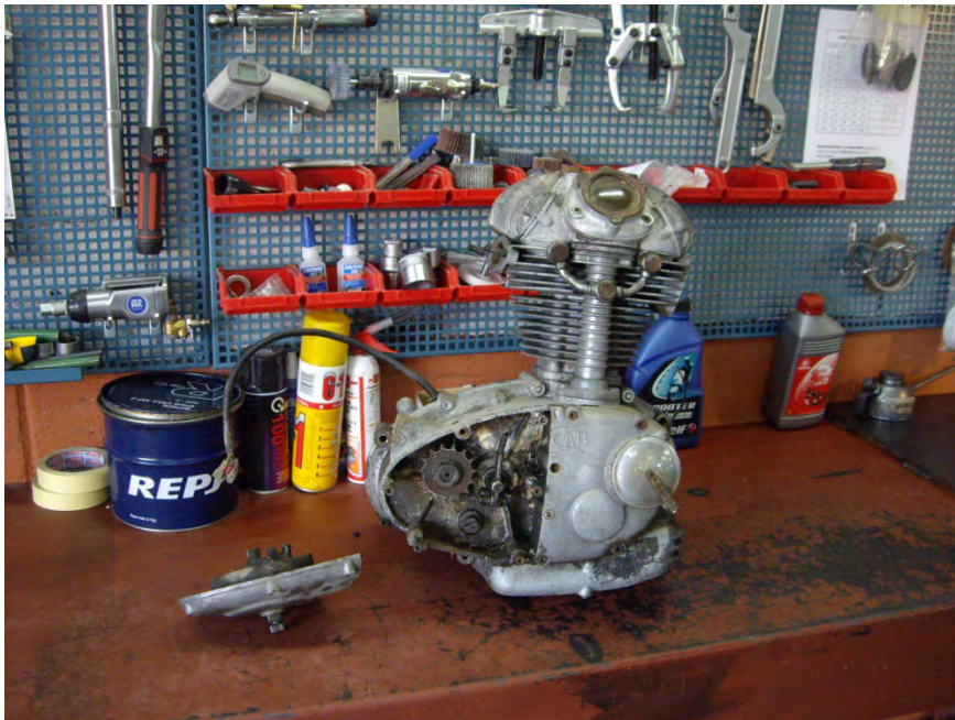
Desmuntatge del motor

El carburador que presentava la moto no era l'original, es substitueix per un dell-orto de 24mm, i se li col·loca un filtre usat original i repintat.