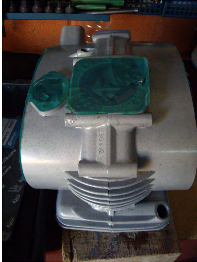
Carter polit i lacat