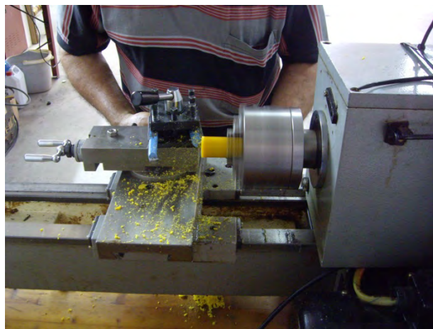
Fabricació de topalls i silentblocs amb el torn.

Finalment en el cavallet central s'arreglen els topalls metàl·lics que estaven malmesos i es refabriquen unes gomes noves per fer de topall.