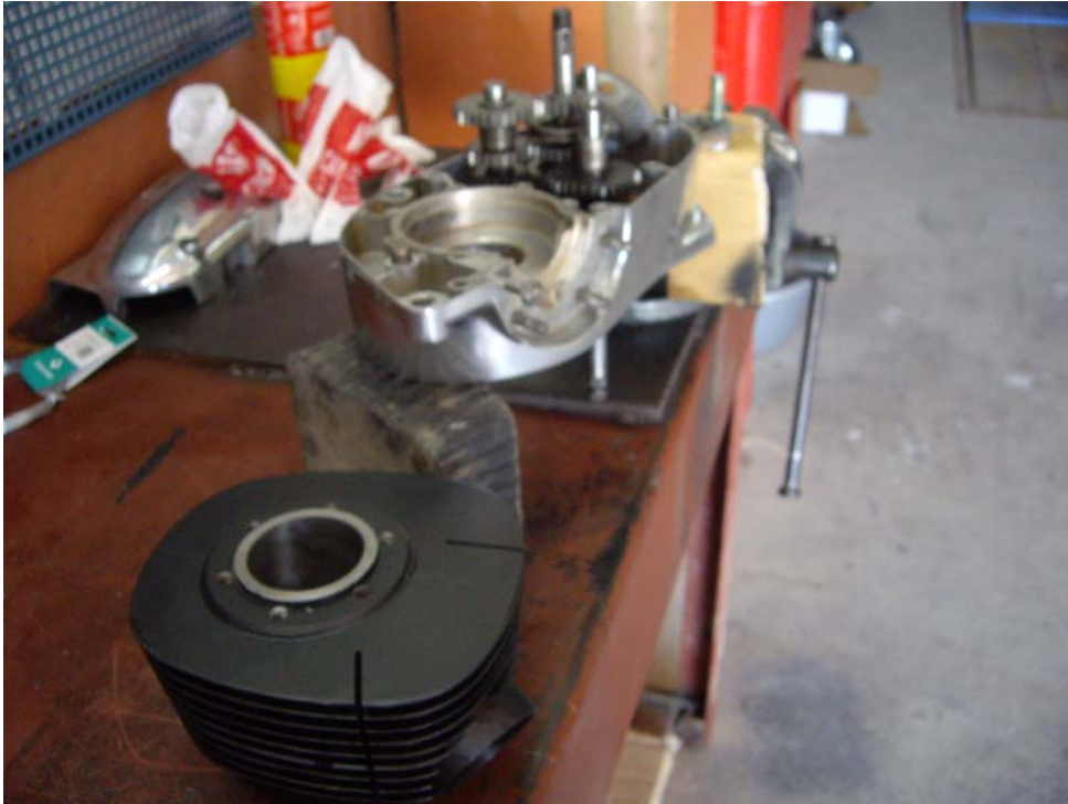
Inici del muntatge