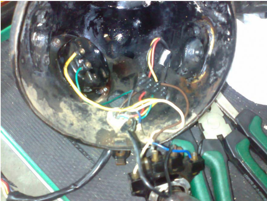
Instal·lació original del llum