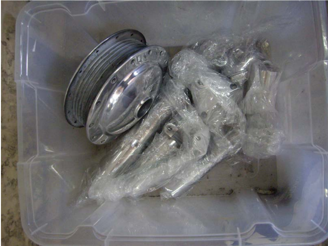
Cub anterior polit i sense pintar.