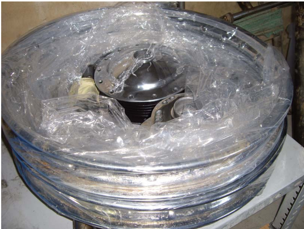
Llandes polides i cubs pintats