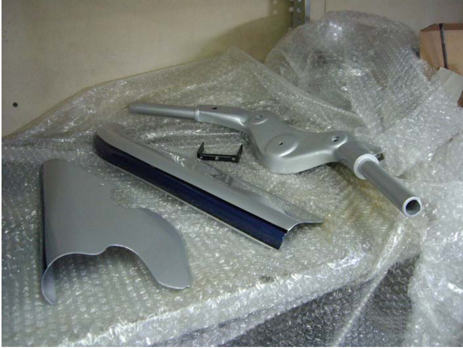
Peces de la carrosseria acabades