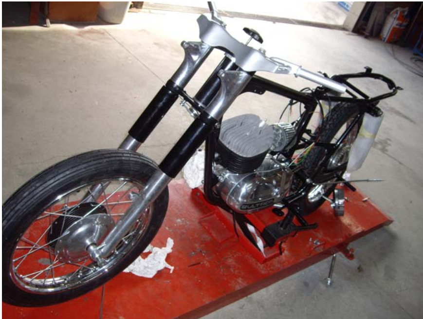
Manillar i suspensió un cop restaurats