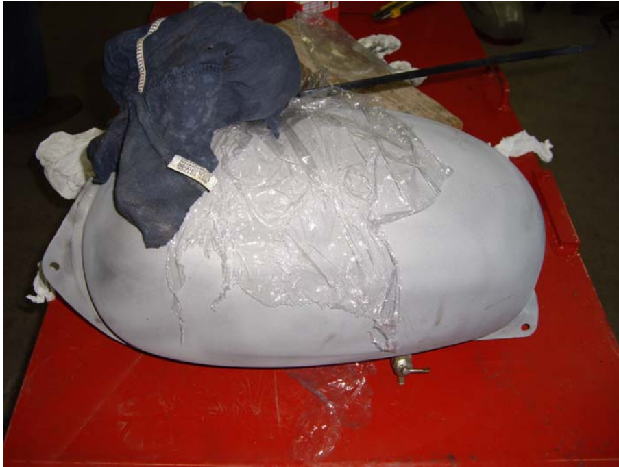
Dipòsit sorrejat i tapat, llets pel tractament químic.

Es procedeix al sorrejat del dipòsit i se li realitza un tractament químic intern per evitar futures fugues i realitzar-li una neteja. Posteriorment es procedeix a pintar-lo amb el color original i a col·locar-li uns anagrames nous, l'aixeta es canvia ja que l'original es troba inoperativa.