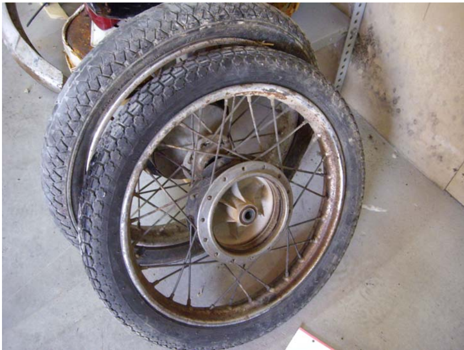
Llandes i cubs abans de polir.

Ambdues rodes són desmuntades per complet, es poleixen els cubs i pinten de negre, les llandes i els radis es canvien. Després es procedeix al radiat de nou i es munten càmeres i pneumàtics nous.