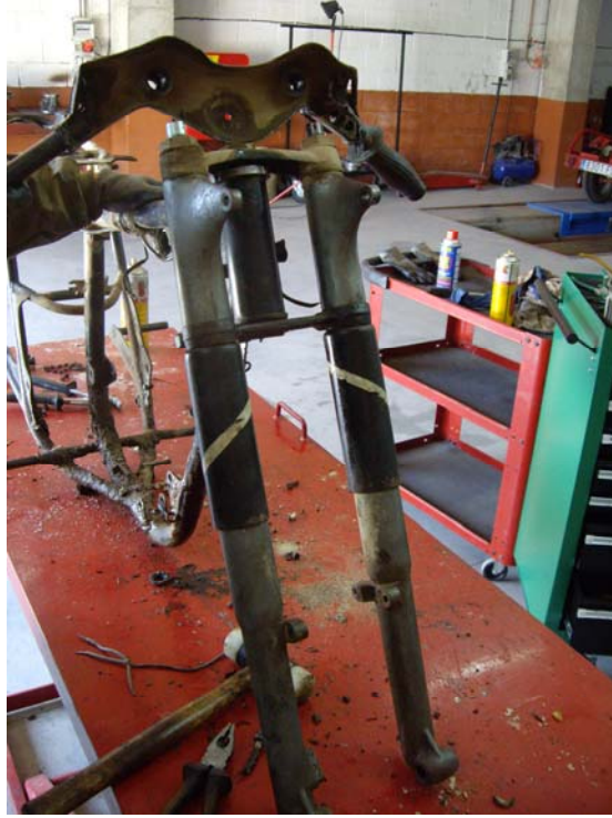
Manillar i suspensió en estat original