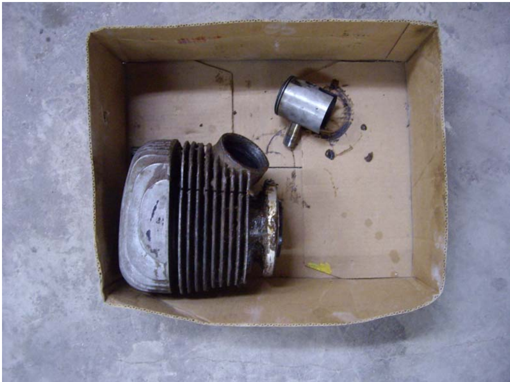
Cilindre, pistó i culates en l'estat original